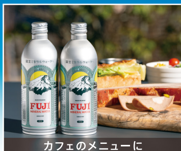
カフェのメニューに