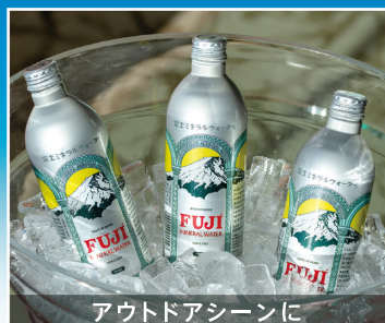
アウトドアシーンに