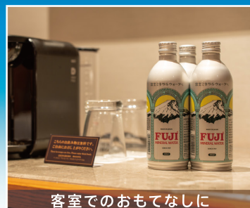
客室でのおもてなしに